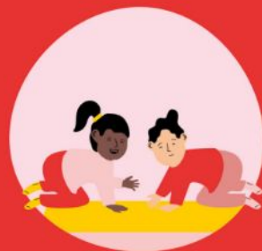
Stoeien en vechten