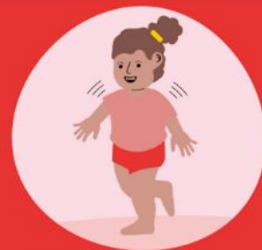
Balanceren en vallen