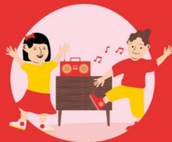
Bewegen op - en maken van muziek