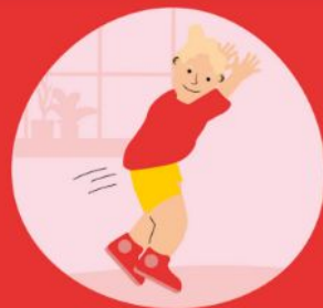
Springen en landen