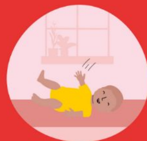
Rollen, duikelen en draaien