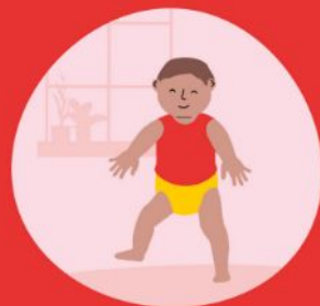
Gaan en lopen