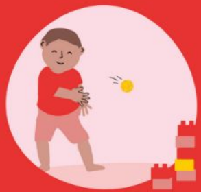
Gooien, vangen, slaan en mikken