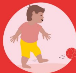
Trappen, schieten en mikken