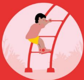
Klimmen en klauteren