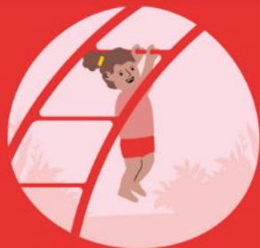
Zwaaien en slingeren